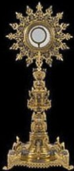
Custodia de Moli-

!!! Adorado sea Jesús Sacramentado !!! !!! Ave María Purísima !!!